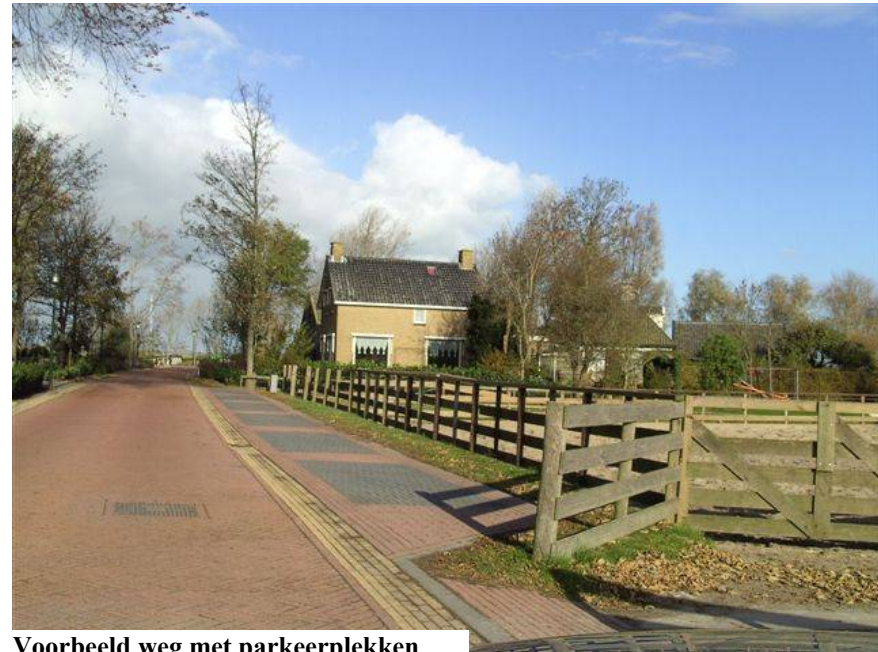
Voorbeeld weg met parkeerplekken

Om bovenstaande problemen op te lossen kan de weg verbreed worden vanaf de Nijhuizumerbrug tot aan beide campings. In ieder geval van ene camping op nummer 4 tot aan de camping op Nummer 19. Een strook van 50 cm aan beide zijden van de bestaande weg in een afwijkende kleur voor fietsers is een praktische invulling daarvan. Tevens willen we op de in- en uitritten van de boerderijen, daar waar nodig, een uniforme geasfalteerde verbreding. Deze verbreding kan tevens als passeerstrook dienen voor zwaar verkeer.