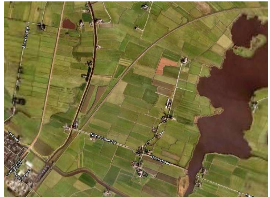
Situatie t.o.v spoorlijn en de meren

In de dorpskern willen we een plek waar huizenbouw voor eigen bewoners wordt toegestaan. Dit stukje grond krijgt de bestemming wonen. De woningen moeten zodanig gesitueerd worden dat de bedrijven niet beperkt worden in hun bedrijfsvoering. Nijhuizum is tenslotte een agrarisch dorp met kleinschalige recreatieve voorzieningen en dat willen we graag zo houden.