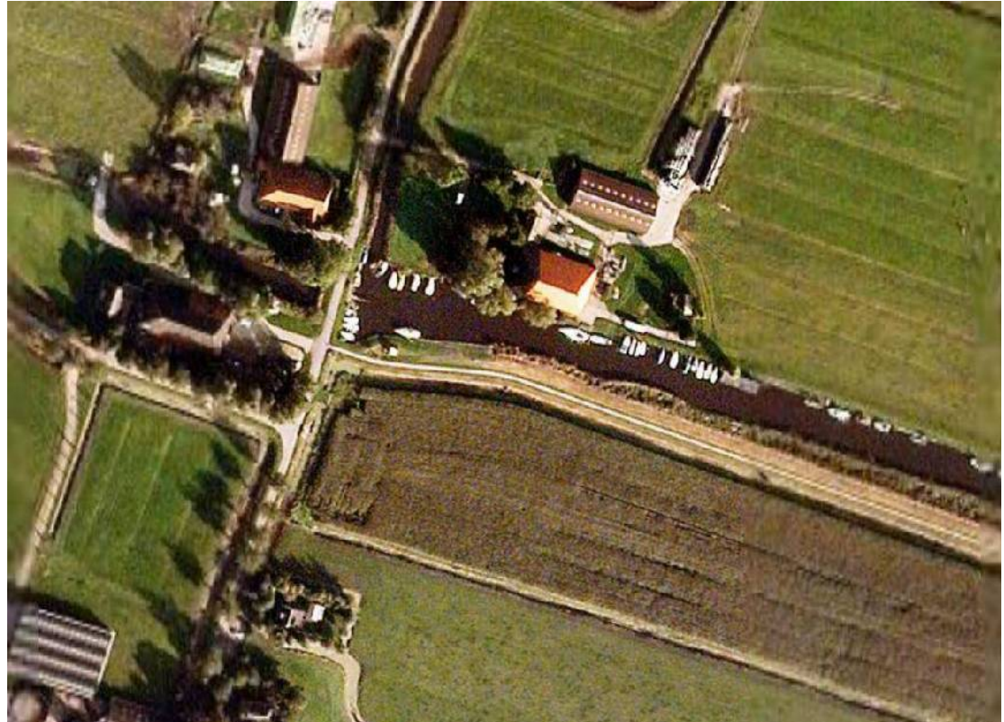
Overzicht kern met haventje