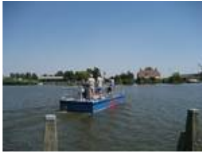
Pontje over de Grons