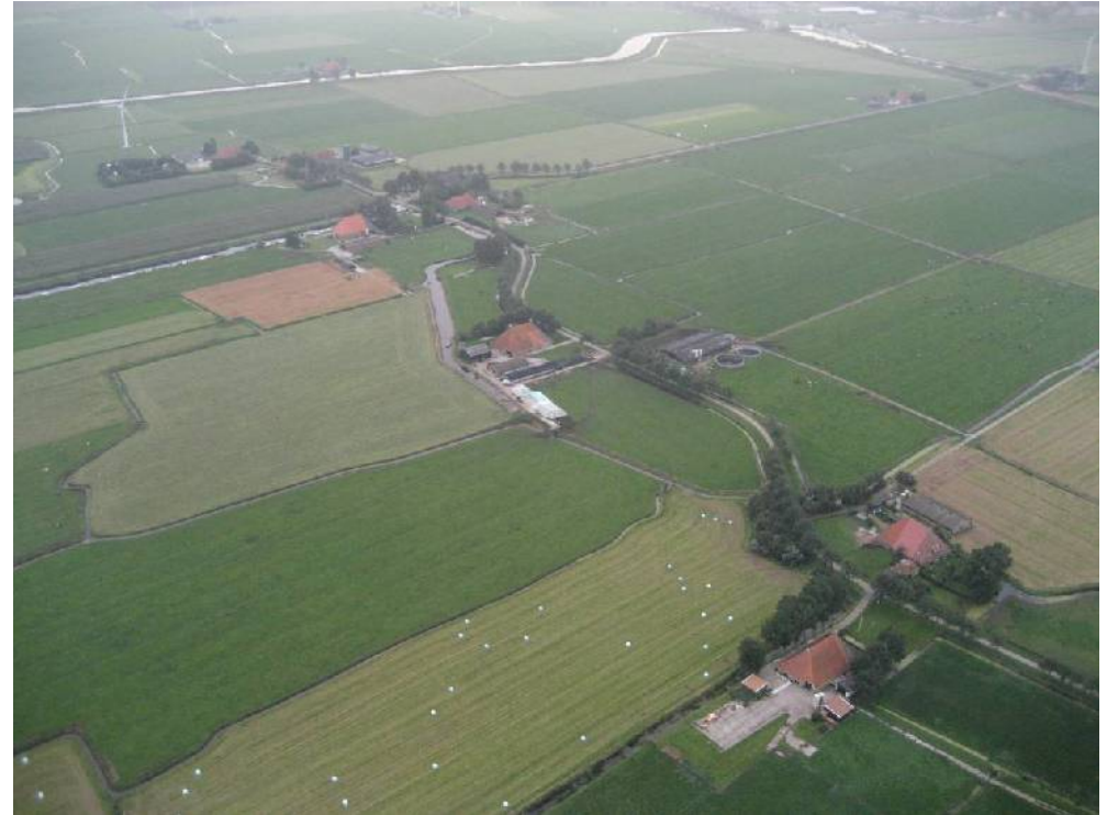
Overzicht deel Nijhuizum