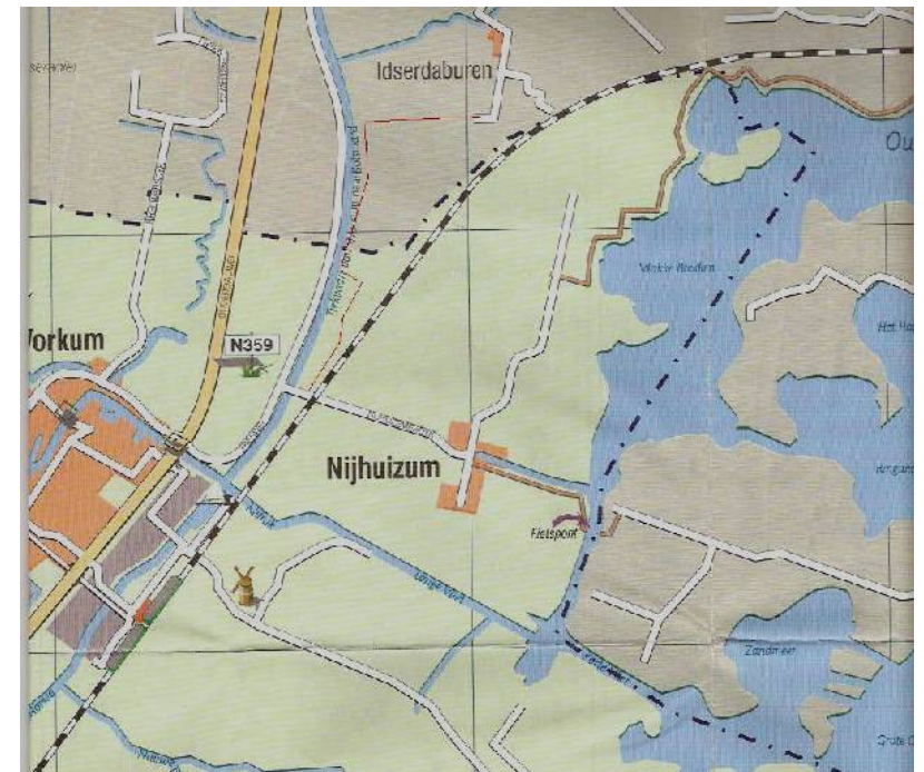
Fietspad naar Hieslum

Het tracé van het nieuwe fietspad ligt tussen de Trekvaart Workum-Bolsward en de spoorlijn. Het begint bij Trekweg 5 en komt uit bij Nijhuizumerdijk 1. Het fietspad staat in oranje aangegeven op het kaartje.