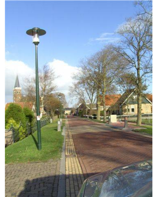
Verlichting met uitstraling

Daarom wil dorpsbelang hier parkeergelegenheid creëren. Ongeveer 200 meter vanaf het haventje is een kleine parkeerplek. De meeste mensen vinden dit te ver weg of ze weten niet dat deze parkeergelegenheid er is, terwijl het wel is aangegeven. Eigenlijk is het ook bedoeld voor bezoekers aan het kerkje. In de berm tussen de Menno's Pleats en nummer 11 is plaats voor drie nieuw aan te leggen in lijn staande parkeervakken. Op die manier worden de auto's gedwongen om in de vakken te parkeren en staan ze niet meer gedeeltelijk op de weg. Tevens is het wenselijk dat er parkeergelegenheid komt bij het eerste informatiepaneel bij Nijhuizumer dijk 1 en bij het voetpad naar de nog te restaureren spinnenkopmolen.